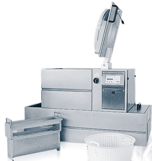
SWA 100.2 Fino a 200 kg/h