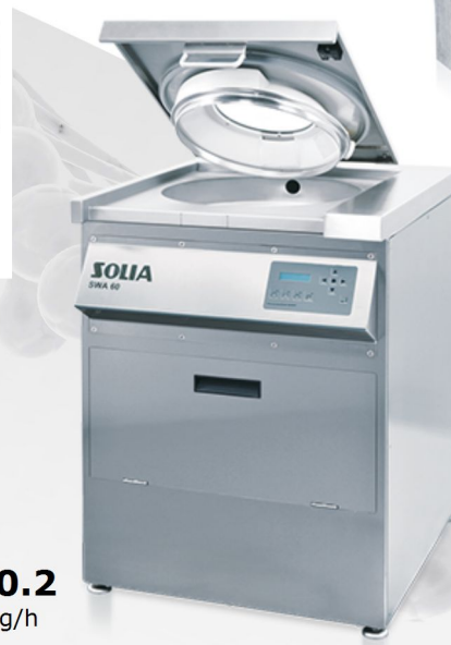
SWA 60.2 Fino a 80 kg/h