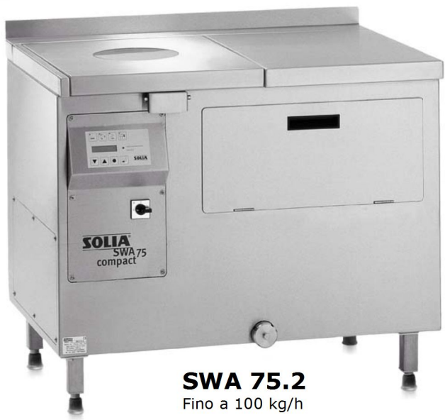
SWA 75.2 Fino a 100 kg/h